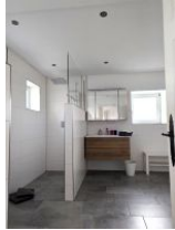
Großes Bad mit Dusche und WC