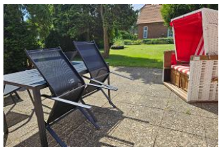
Grosser Garten mit Strandkorb

--Mach mal Foehr Angebot-- Wir begrüßen Sie in "Innas Hus" in Wyk auf Föhr, einem alten Kapitänshaus aus dem Jahr 1910. Das Haus wurde bis Mitte 2023 umfangreich renoviert. Es wurde Wert darauf gelegt, die alte Bausubstanz zu erhalten und mit neuen, modernen Elementen zu verbinden. Die Ferienwohnung im Erdgeschoss bietet auf ca. 105 m² Wohnfläche Platz für 4 (-5) Feriengäste. 2 Schlafzimmer, ein Wohnzimmer, ein offener Küchen-Ess-Bereich sowie ein großes und ein kleines Badezimmer sind Bestandteil der Ferienwohnung. Zudem stehen ein Gartenanteil mit großer Terrasse mit Strandkorb und Stellplatz für 1(-2) PKW zur Verfügung. Innas Hus zeichnet sich durch seine zentrale Lage im Herzen von Wyk aus. Die Ortsmitte mit der Fußgängerzone, Einkaufsmöglichkeiten und der Strand sind in wenigen Minuten zu Fuß oder mit dem Fahrrad zu erreichen.