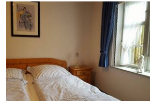
Im gemütlichen Schlafzimmer kann man seinem Traum freien Lauf lassen