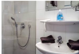
Neues ebenerdige Dusche