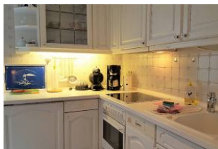
In dieser Küche macht das Kochen Spaß. Die Terrasse ist von hier direkt begehbar.