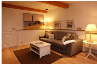
...hier noch einmal die Couchecke...