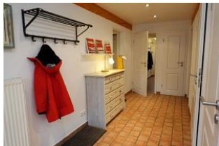
...treten Sie ein, schauen sich um ...

Das Haus Friesengeist in Wrixum für max. 7 Personen hat seine Besonderheiten. Ursprünglich als 2-Familien-Haus gedacht, vermieten wir nur noch an eine Gästepartie, niemand stört den Anderen. So verfügt das Friesengeist über zwei voll eingerichtete Wohneinheiten, dadurch gibt es für jedes Familienmitglied eine Rückzugsmöglichkeit. Ideal für mehrere Generationen, die gemeinsam Urlaub machen, aber auch gern einmal eine Tür hinter sich schließen möchten. Ein gemütliches, altes Friesenhaus in der Stille Wrixums - herrlich !