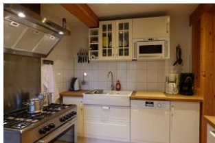
Die ganze Küche.