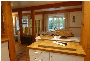
Der Blick von der Küche in den Essbereich.