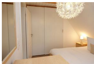
...mit großem Kleiderschrank