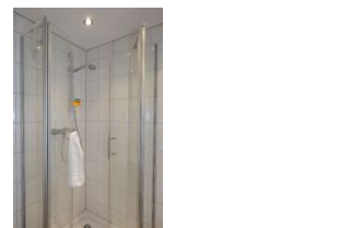
Das Badezimmer im Obergeschoß mit Dusche....