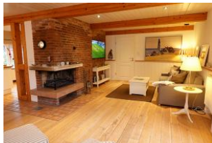
....für den Fernsehabend....