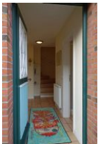
Treten Sie ein und fühlen sich einfach wohl....

...wer mag nicht gern beim aufwachen den Geruch von frisch gebackenen Brötchen riechen ??? Sie müssen die Backwaren noch selbst holen, aber es sind nur ein paar Schritte bis zum Bäcker Hansen Das Haus Kastanie bietet eine moderne Doppelhaushälfte für 4 Personen + Baby (im Notfall gibt es auch noch zwei weitere Schlafplätze) Eine voll eingerichtete Küche, Wohnzimmer mit großzügigem Essplatz, 2 Duschbädern und zwei Schlafzimmern ! Hier findet die ganze Familie Platz. Und Ihre Fellnase darf auch mit. Kommen Sie, schauen Sie...und fühlen Sie sich einfach wohl !