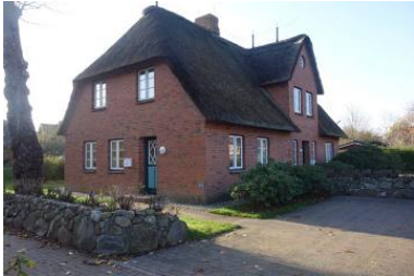
Das Ferienhaus OHI Dörp 49f in Wrixum im Herbst

Die Unterkunft verteilt sich über EG und EG.