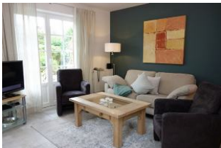
...vorn links im Bild, das TV -Gerät