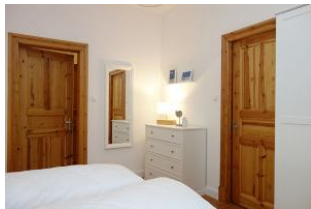
...Kommode und Ganzkörperspiegel...