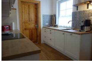
...die rechte Küchenzeile die Spüle, Kaffeemaschine und vieles mehr...