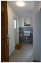
Der Durchgang zum Hintereingang und zur...