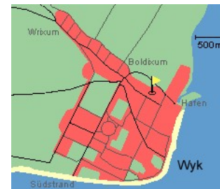
Entfernungen, zirka: zum Bäcker 50 m, zur Einkaufsmöglichkeit 50 m, zum Flugplatz 3,0 km, zum Golfplatz 3,1 km, zum Hafen 500 m, zum Meer 350 m, zum ÖPNV 70 m, zum Badestrand 350 m, zum Ortszentrum 100 m