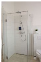
... großer, ebenerdiger Dusche.