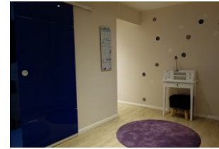
Hinter der Glastür verbirgt sich ....