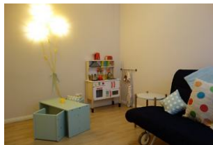
...und für unsere kleinen Gäste ein Tisch mit Stühlen und eine Spielküche