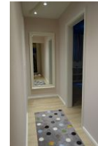
Der Flur führt rechts ins Schlafzimmer, links ins Spielzimmer