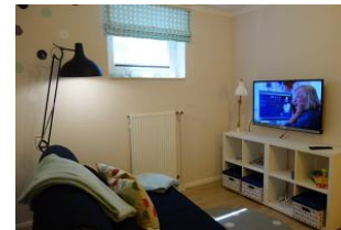
...TV Gerät und DVD Player