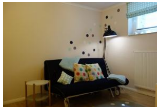
Das Spielzimmer mit Schlafcouch für Besuch...