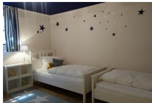
Das Schlafzimmer in der U 20 Zone mit 2 Einzelbetten 90x200cm, Sternenhimmel....