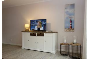
...TV Gerät und DVD Player ...