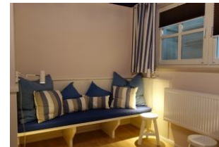
...herrlicher "Chillbank" !