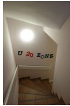
Zugang zur U 20 Zone