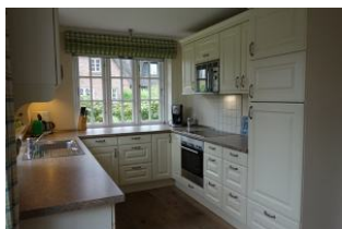
Die Küche von der einen...