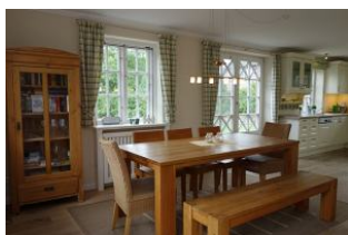
Der Essplatz, im Hintergrund die Küche