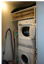
Waschmaschine und Trockner, Bügelbrett und Bügeleisen.