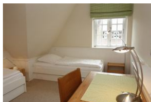
Das Kinderzimmer mit zwei Einzelbetten.