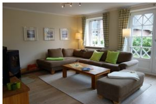
Genügend Platz für Alle ....