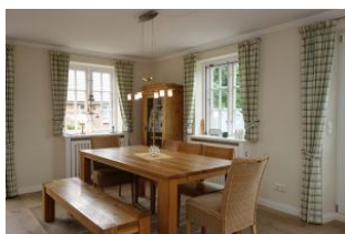
Hier noch einmal der Essplatz, hell und freundlich