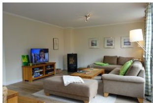
...einem gemütlichen Abend steht nichts mehr im Weg.