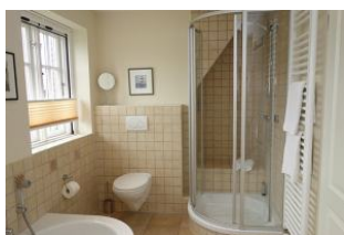
Die Dusche und Toilette im Bad im OG