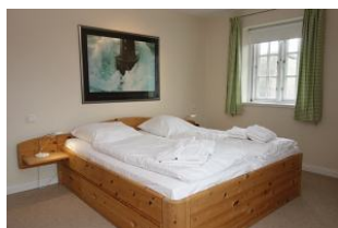
Das Doppelschlafzimmer im OG...