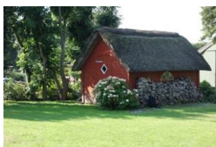
Im Schuppen dürfen Sie gern Ihre Räder unter stellen.