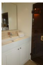
Das Waschbecken im Bad im OG, Eingang zur kleinen Sauna