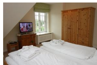
...mit TV Gerät