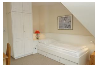
.... unter diesem befindet sich noch ein Ausziehbett.