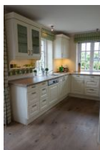
.... und der anderen Seite.