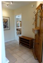
Der Flur im Eingangsbereich