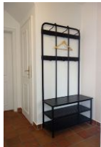
Die Garderobe im Flur.

Bitte wenden Sie sich an die Kollegen der Agentur "hoch im norden GmbH" Telefon: 04681.741390 oder per mail an: wirsind@hochimnorden.sh Vielen Dank.