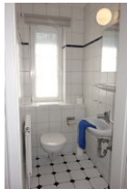
Das Gäste - WC im Erdgeschoss