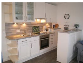
Die Küche mit Backofen.