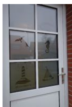
...Herzlich Willkommen !

Unsere kleine Haushälfte am Wyker Südstrand steht nur wenige Schritte vom Leuchtturm entfernt. Sie können das Meer zwar nicht sehen, aber hören und vielleicht auch riechen. Für 2 Personen ideal, aber auch 4 Personen finden hier Platz für einen erholsamen Familienurlaub. Wohnzimmer und Küche - total gemütlich. Festnetz Flat und WLAN Verbindung sowie die Nutzung der Waschmaschine sind kostenfrei.