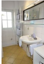
Das Bad mit...