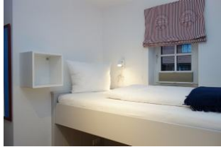
Das obere Bett