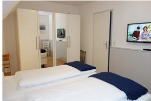
Großer Schrank für düt un dat....