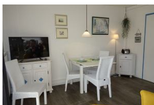
Esstisch und TV Gerät.