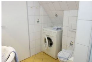
... und Waschmaschine