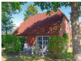
Die Terrasse, schön eingewachsen !