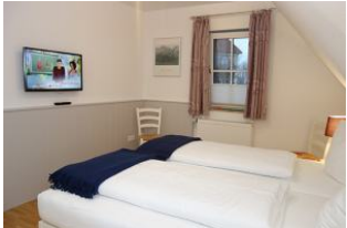
Das zweite TV Gerät im Schlafzimmer