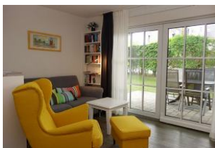
Der gemütliche Sessel mit Blick " ins Grüne....."