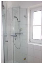
...Dusche, neu mit Glastür.