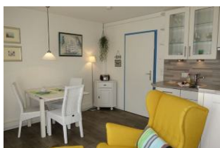
Sessel, Küche, im Hintergrund der Esstisch.