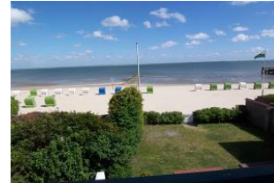
Das Foto zeigt den Blick vom Balkon des Hauses und das lädt zu jeder Jahreszeit ein. Hier können Sie einen Erholungsurlaub der kurzen Wege mit Nordseeluft pur genießen. Man spürt regelrecht die leichte Meeresbrise.....