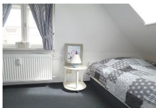
Das zweite gemütliche Schlafzimmer im Dachgeschoss verfügt über 2 Einzelbetten.