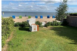
Der Garten mit überdachter Terrasse, Strandkorb (April-Oktober), Gartenmöbeln und direktem Strandzugang steht Ihnen zur alleinigen Nutzung zur Verfügung.