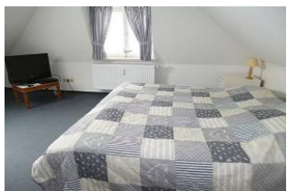
Unter gemütlichen Dachschrägen befindet sich das behagliche Schlafzimmer mit Doppelbett. Dieses kann auch zu zwei Einzelbetten auseinander geschoben werden. Flat-Screen TV und DVD-Player stehen zur Verfügung.