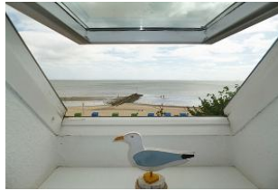
Von den Schlafräumen im DG hat man einen traumhaften Ausblick!