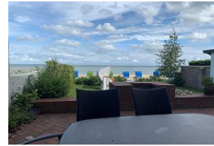
Die überdachte Terrasse ist möbliert.