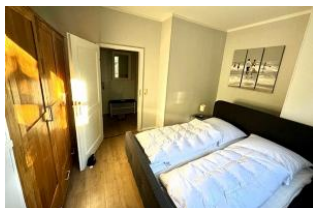
Der helle Schlafbereich, in dem Sie vom verbrachten Urlaubstag träumen können.