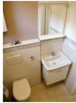
Das kleine Duschbad...