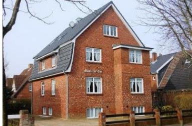
Die Unterkunft befindet sich im EG Hochparterre.