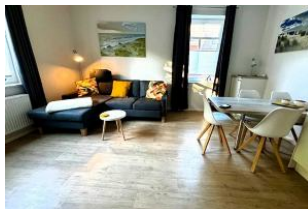
Das gemütliche Wohnzimmer. Die Couch kann als Schlafplatz für bis zu zwei weitere Personen genutzt werden.