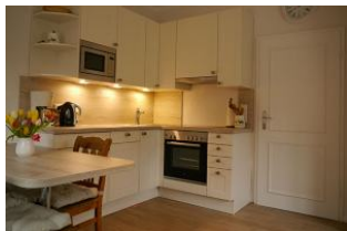
Die moderne Küche lässt keine Wünsche offen.

Herzlich willkommen im "Haus zur See", Badestr. 92 in Wyk. Ihre Wohnung befindet sich im Hochparterre einer kleinen Wohnanlage und hat einen schönen gemeinschaftsgarten, der ruhig gelegen und nach S-W ausgerichtet ist. Ein kostenfreier Stellplatz für Ihr Fahrzeug ist auf dem Grundstück vorhanden. Das Wohnzimmer mit Küchenzeile verfügt über zwei Fenster und ist dadurch hell und freundlich. Das Sofa lässt sich zum Schlafen ausziehen. In 5 Gehminuten erreichen Sie den herrlichen Südstrand. Im Umkreis von 300m finden Sie Bäcker, Schlachter, Lebensmittelmarkt und kleine Restaurants.