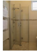
...mit Tageslicht und ebenerdiger Dusche.