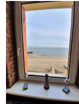
Der Blick aus dem Fenster auf die Nordsee