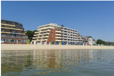
Das Haus von außen