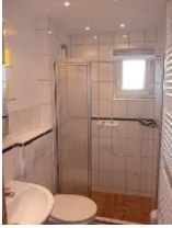
... mit großem Duschbereich