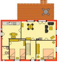
Der Grundriss der Wohnung im Erdgeschoss.