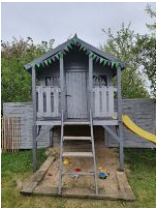
Der gemeinschaftliche Spielplatz lädt Kinder zum Toben und Klettern ein.