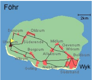
Entfernungen, zirka: zum Bäcker 800 m, zur Einkaufsmöglichkeit 800 m, zum Hafen 12 km, zum Meer 500 m, zum Ortszentrum 800 m