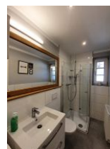
Das hellgeflieste Duschbad mit Fenster.