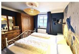
Auch hier befindet sich genügend Stauraum für Ihre Urlaubsgarderobe.