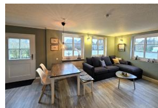
Der gemütliche Wohnschlafraum ist lichtdurchflutet und bietet zusätzlich eine nette Ess- und Sitzgruppe an.