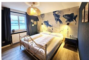
Für erholsamen Schlaf sorgt das liebevoll eingerichtete Schlafzimmer.

Das Haus Nis Puk ist nur ca. 800 m vom Dorfkern Utersum entfernt, so dass Sie fußläufig alles erreichen können, was Sie für den täglichen Bedarf benötigen. Der Strand ist nur wenige Gehminuten entfernt, hier kann man die phänomenalsten Sonnenuntergänge der gesamten Insel erleben. Die im Erdgeschoss befindliche Wohnung mit Terrasse & gemeinschaftlichem Garten sowie Spielplatz ist mit ihren ca. 50 qm groß genug für 2 bis 4 Personen und besitzt alles, was Sie sich für einen erholsamen Urlaub wünschen: Von dem eigenen Parkplatz, dem Wohnschlafraum mit WLAN, dem gemütlichem Schlafzimmer, einem Bad mit Dusche bis zu einer vollausgestatteten Kochnische.