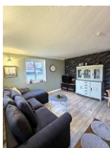
Die moderne Fernsehecke.