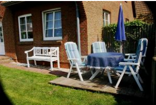
Die einladende Terrasse zum Verweilen nach einem langen Strandspaziergang.