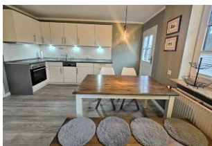
Die neue und helle Kochnische der Ferienwohnung Nis Puk mit Backofen und Geschirrspüler.