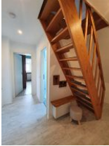
Der helle Flur