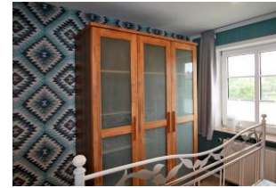
Der Kleiderschrank im Schlafzimmer