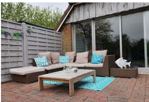
Die Gemeinschaftsterrasse vor dem Haus