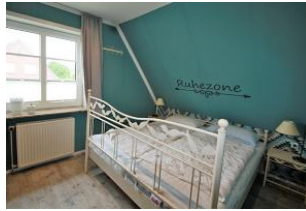
Für erholsamen Schlaf sorgt das liebevoll eingerichtete Schlafzimmer.