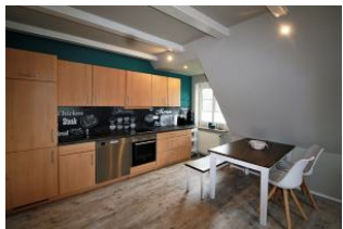
Die vollausgestattete Küche

Das Haus Nis Puk ist nur ca. 800m vom Dorfkern Utersum entfernt, so dass Sie fußläufig alles erreichen können, was Sie für den täglichen Bedarf benötigen. Der Strand ist nur wenige Gehminuten entfernt, hier kann man die phänomenalsten Sonnenuntergänge der gesamten Insel erleben. Die im Obergeschoss befindliche Wohnung ist mit ihren 60 qm 2 , dem eigenen Parkplatz und den zwei gemütlichen Schlafräumen, dem Wohnraum mit WLAN-Zugang, einer vollausgestatteten Kochnische und dem Duschbad ideal für 4/5 Personen geeignet und lädt mit der stilvollen Einrichtung, die liebevoll ausgewählt wurde, sowie einer Sitzecke im Garten zum Wohlfühlen & Relaxen ein.