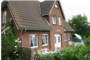
Die Unterkunft befindet sich im 1.OG.

Die Außenansicht des schönen Friesenhauses mit den insgesamt 4 Wohnungen. Diese Ferienwohnung ist in spiegelverkehrter Form im Haus ein weiteres Mal auf derselben Etage vertreten. Sprechen Sie uns bei Bedarf gerne an.