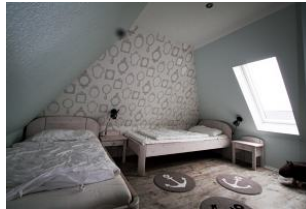
Das zweite Schlafzimmer mit drei Einzelbetten liegt im 2. Obergeschoss.