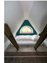
Der wohl schönste Schlafplatz im Kinderzimmer.