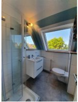
Das Bad mit Dusche.