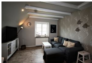
Modern & stilvoll, hier können sich unsere Gäste im Wohnzimmer heimisch fühlen und es sich gemütlich machen.