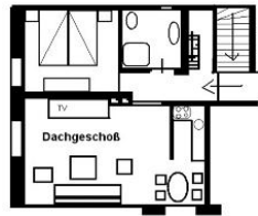
Der Grundriss der Wohnung.