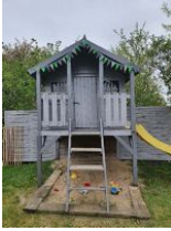
Der gemeinschaftliche Spielplatz lädt Kinder zum Toben und Klettern ein.