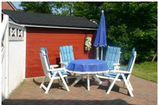
Eine nette Sitzecke auf der Terrasse darf hier nicht fehlen. Ideal um bei Sonnenschein ein Stückchen Friesland in aller Ruhe zu genießen.