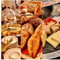
umfangreiches Frühstücksbuffet (kostenpflichtig)