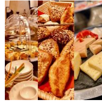
umfangreiches Frühstücksbuffet (kostenpflichtig)