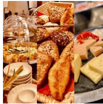
umfangreiches Frühstücksbuffet (kostenpflichtig)