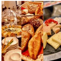
umfangreiches Frühstücksbuffet (kostenpflichtig)