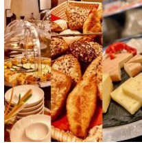
umfangreiches Frühstücksbuffet (kostenpflichtig)