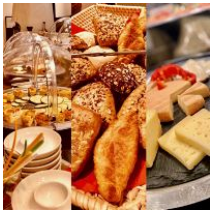
umfangreiches Frühstücksbuffet (kostenpflichtig)