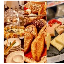
umfangreiches Frühstücksbuffet (kostenpflichtig)