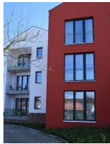
Balkon im 1.OG