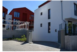
Einfahrt zur Tiefgarage