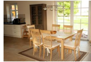
Ihr Essbereich mit schönen Blick in die Natur und Zugang zur Terrasse