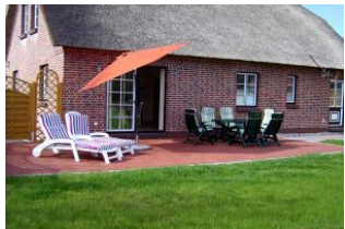
Eine andere Sicht.

Sie suchen Entspannung und Erholung pur, wollen den Alltagsstress hinter sich lassen, dann sind Sie bei uns gerade richtig! Das modern eingerichtete Reetdachhaus mit einer großzügig angelegten Terrasse in Südlage und Rasenflächen zum sonnen laden regelrecht zum Verweilen ein. In dem Garten haben unsere kleinen Gäste viel Platz zum Spielen. Der Spielplatz und ein Reiterhof sind bequem zu Fuß zu erreichen. Auch zum Badestrand sind es zu Fuß oder mit dem Rad nur wenige Minuten. Das 2011 erbaute Reetdachhaus liegt 2 km von Büsum entfernt, im Urlaubsort Stinteck. Gleich hier beginnen viele Rad- und Wanderwege entlang der Nordseeküste durch das ebene Marschland. In dem anspruchsvoll ausgestatteten Ferienhaus mit 3 Schlafräumen ist Platz für bis zu 6 Personen. Ein Babybett und ein Hochstuhl stehen Ihnen kostenlos zur Verfügung. Der großzügige Wohn- und Essbereich, eine Sitzcke im Dachgeschoß und ein zweites TV im Schlafzimmer bieten Ihnen viele Entspannungsmöglichkeiten. Die komfortable Küche ist u. a. ausgestattet mit Geschirrspüler, Backofen, Gefrierschrank und Mikrowelle. Außerdem steht Ihnen ein Carport mit Fahrradabstellraum zur Verfügung.