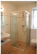
Ihr Duschbereich im Erdgeschoss.