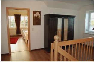
Die Galerie mit Zugängen zu den Schlafräumen