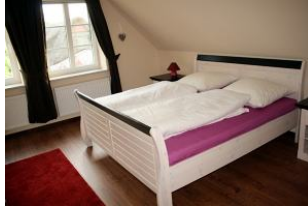
Das große Schlafzimmer im oberen Bereich. Genügend platz zum Träumen.