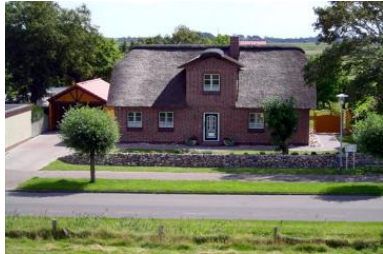
Wohnen unter Reet

Stinteck, Westerdeichstrich, Stinteck 43