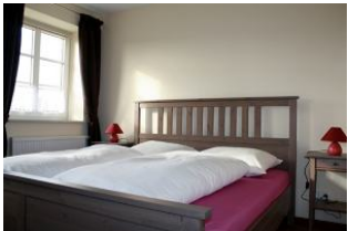
Das gemütliche Elternschlafzimmer im Erdgeschoss.