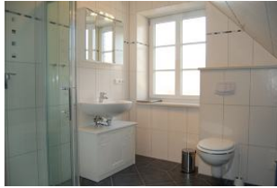
Das Duschbad in der oberen Etage.