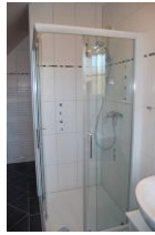
Das obere Duschbad aus einer anderen Sicht.