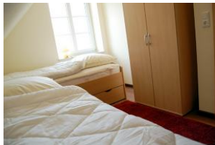
Das Schlafzimmer für zwei weitere Person in der oberen Etage. Hier stehen jetzt zwei Einzelbetten.