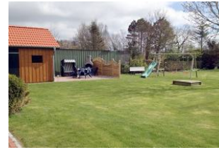
Herrlich diese Wiesenlandschaft