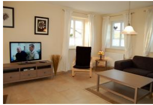
Vor dem großen flachbild-TV können Sie gemütlich relaxen