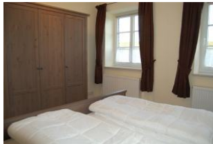
Die andere Sicht des Schlafbereiches.