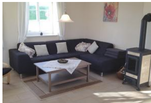
Der Wohnbereich mit großzügiger Wohnlandschaft