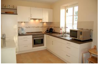
Die neue geschmackvolle Küche lässt keine Wünsche offen und lädt zum Kochen ein