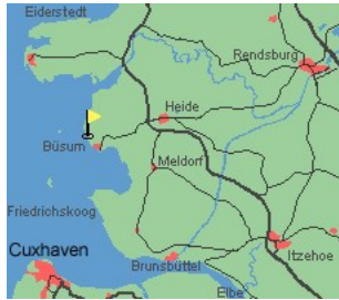
Entfernungen, zirka: zum Bäcker 100 m, zur Einkaufsmöglichkeit 100 m, zum Meer 400 m, zum Badestrand 400 m