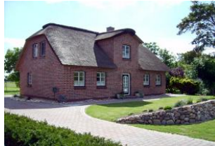
Dieses Haus lässt keine Wünsche übrig.