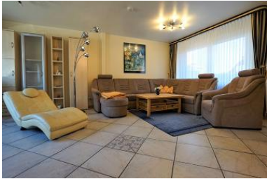
Die Unterkunft verteilt sich über EG und 1.OG.

Die große komfortable, 4-Sterne 2-Raum-Whg. mit einer sehr hochwertigen Ausstattung und Liebe zum Detail, liegt im Herzen von Büsum. So ist es Ihnen möglich, die zentrale Lage kombiniert mit Ruhe für Ihre Entspannung, zu genießen. Der große Balkon (Loggia) wird Ihnen sicherlich ebenfalls sehr gefallen. Um in den Ortskern mit seinen vielen Einkaufsmöglichkeiten und Gaststätten zu gelangen, brauchen Sie zu Fuß ca. 5 Min.(ca. 300 m zum Zentrum). Auch das Gäste- und Veranstaltungszentrum, sowie der Hauptstrand sind bequem in kürzester Zeit zu Fuß erreichbar. Die Komfort Wohnung ist ca. 100qm groß und mit 4 Sternen klassifiziert worden. Sie ist sehr hochwertig möbliert und mit Liebe zum Detail ausgestattet. Genießen Sie im Urlaub ein Gefühl von Gemütlichkeit und Luxus.