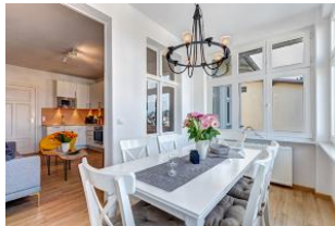
Veranda - Blick in den Wohnbereich mit Küche