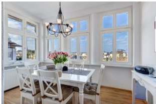
Essplatz in der Veranda mit schönem Ausblick

Geräumige helle 4-Zimmer-Wohnung mit Veranda Richtung Ostsee - mit schönem weitem Blick! Die Wohnung ist gemütlich und freundlich - aber einfach - eingerichtet und ausgestattet. Sie wurde 2014 renoviert, die Bäder und Küche sind dann neu gemacht worden. Die Wohnung verfügt über drei separate Schlafzimmer, Wohnzimmer mit Küchenecke und Essplatz in der Veranda, ein Bad mit Wanne und Dusche, ein kleines Duschbad und einen Eingangsflur mit Garderobe. Die Wohnung verfügt über einen großen Balkon mit Esstisch. Zur Wohnung gehört ein kostenfreier Pkw-Stellplatz auf dem Grundstück. Ein zweiter kann hinzugemietet werden. Die Villa Margarete steht etwas erhöht in der Bergstrasse, wodurch sich der weite Blick ergibt. Die Wohnung befindet sich im I. OG, etwa 300m zur Strandpromenade. Von der Villa Margarete aus können Sie das Ortszentrum und die bekannte Ahlbecker Seebrücke in ca. 8-10 Minuten zu Fuß erreichen.