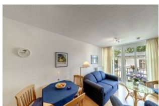
Essbereich und Wohnzimmer

Direkt an der Strandpromenade mit BALKON und FAHRSTUHL im Haus! Schönes geräumiges 2-Zimmer-Apartment mit moderner guter Ausstattung. Separates Schlafzimmer, Wohnzimmer mit Küchenzeile und Essplatz, Duschbad, Balkon zur Westseite mit Abendsonne. Die Wohnung verfügt über einen Tiefgaragen-Pkw-Stellplatz. In der Garage können auch Fahrräder und ähnliches untergestellt werden. In unserer "Villa Germania" nebenan gibt es eine Sauna. Von der "Villa Aquamarina" aus können Sie das Ortszentrum und die bekannte Ahlbecker Seebrücke in ca. 3 Minuten zu Fuß erreichen. Zum Strand sind es 50 m.