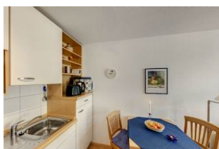
Küche mit Esszimmer