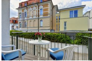
Balkon nach Süden