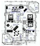
Wohnungsgrundriss (Möblierung exemplarisch)