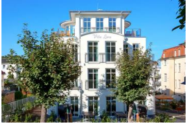
Hausansicht aus der Architektenplanung