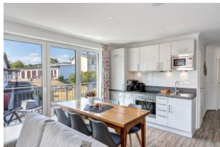
Küche und Essplatz