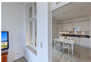
Blick in die Wohnküche