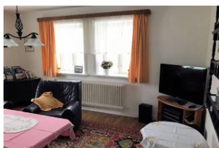
Wohnzimmer mit TV

In dieser Haushälfte eines Doppelfriesenhauses wohnen Sie auf 2 Ebenen und können die Vorzüge eines großen Garten mit Grill und Gartenmöbeln genießen. Das Haus liegt auf dem Grundstück eines Bauernhofes in ruhiger Dorfrandlage. Von hier können Sie Ausflüge ins benachbarte Dänemark unternehmen.