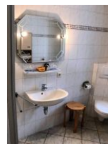
Badezimmer mit Dusche in EG