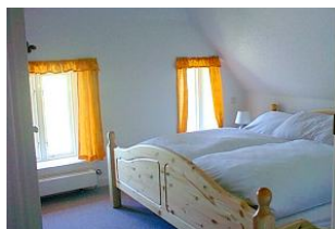
Schlafraum mit Doppelbett im OG