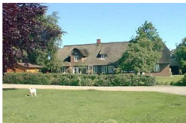
Haushälfte eines reetgedeckten Friesenhauses

Die Unterkunft verteilt sich über EG und 1.OG.