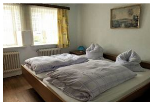
Schlafraum mit Doppelbett im EG