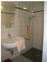
... einer Dusche ohne Wanne, Ecken und Kanten.