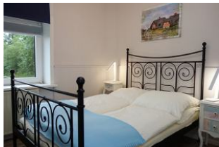
Ein Zimmer mit Doppelbett 160x200cm und ...