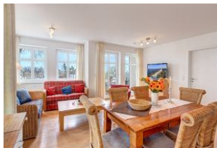
Essplatz und Blick zu Wohnbereich und Balkon