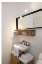
Das frisch (4/2023) renovierte Bad mit...

Entfernungen, zirka: zum Bäcker 300 m, zur Einkaufsmöglichkeit 800 m, zum Flugplatz 2,9 km, zum Golfplatz 3,0 km, zum Hafen 800 m, zum Meer 200 m, zum ÖPNV 400 m, zum Badestrand 200 m, zum Ortszentrum 800 m