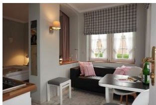
Das App. 2 im Haus Hallig Hooge

Ruhig gelegen, inmitten unseres kleinen Städtchens Wyk finden Sie unser Haus Hallig Hooge, welches insgesamt 7 Wohnungen für jeweils 2 Personen beherbergt. Klein, aber oho präsentiert sich auch das App. 2 - Nordstrandischmoor; ein großzügiges Einraum - Appartement für 2 Personen. Kleiner Wohnbereich mit Küchenpantry, eine halbhohe Mauer trennt den Wohn- vom Schlafbereich. Zugang zum Duschbad. Ein kleiner Abstellraum dient dem Unterstellen von Koffern und Taschen.