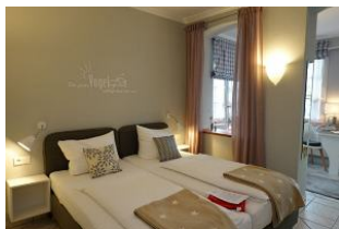
...hier dürfen Sie ausschlafen.