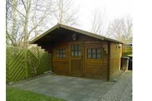
Im Gartenhäuschen können Sie Ihre Fahrräder unterstellen.