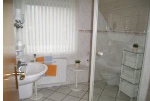
Das helle Badezimmer.