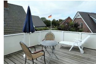
Der schöne Balkon.