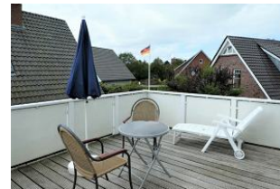
Der schöne Balkon.