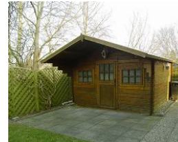
Im Gartenhäuschen können Sie Ihre Fahrräder unterstellen.