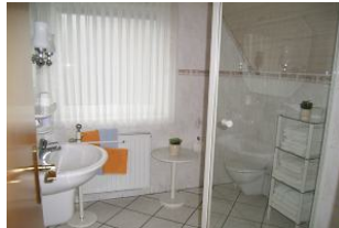
Das helle Badezimmer.