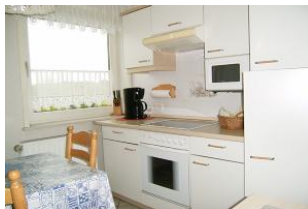
Die Küche ist gut ausgestattet.