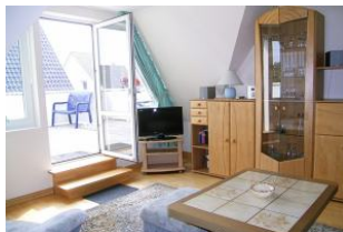
Vom Wohnzimmer gelangen Sie auf den eigenen Balkon.