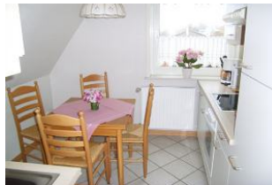
Sie bietet Platz für alle Mitreisenden.