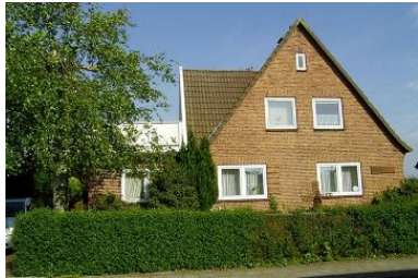
Die Wohnung befindet sich im OG des Hauses.