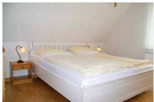
Das Schlafzimmer mit Doppelbett.