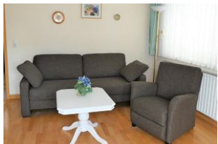
Das gemütliche Wohnzimmer. Das Sofa hat eine Schlaffunktion.

In einer ruhigen Seitenstraße, unweit dem Wyker Zentrum mit allen Einkaufsmöglichkeiten, liegt dieses freistehende, rote Backsteinhaus mit zwei Ferienwohnungen. Die sonnige OG Wohnung hat ein separates Schlafzimmer mit einem Doppelbett und ein Wohn-Schlafzimmer mit einem direkten Ausgang auf den großen Balkon. Im WZ kann das Sofa auch zum Schlafen umfunktioniert werden. Die separate Küche ist gut ausgestattet und hier kann auch gegessen werden. Im Gartenhaus dürfen Sie ihre sperrigen Güter abstellen. In dieser Wohnung können sie ihren Urlaub genießen.