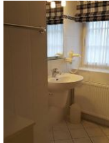
Badezimmer mit Dusche im OG