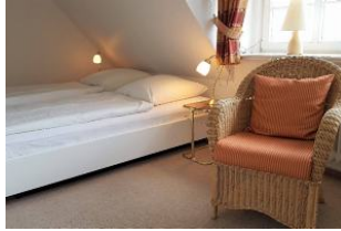
Schlafzimmer mit Doppelbett Einbauschränk und ein weiterer Fernseher