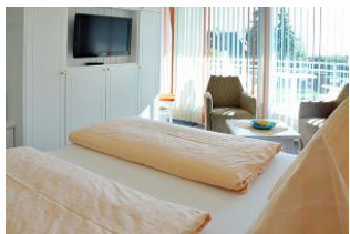
Helles wohnen . . .

Schönes und komfortables Doppelzimmer mit Süd - Balkon und Meerblick. Genießen Sie den einmaligen Blick nach Süden auf die Nordsee und die Halligen. Bitte beachten Sie unsere Sonder - Arrangements.