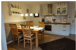
Der Essplatz, im Hintergrund die Küche.