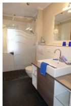
Das Bad mit Handwaschbecken, Toilette und bodengleicher Dusche mit ....

Ein großer Einbauschränk für die Kofferinhalte. TV Gerät.