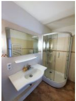
Das geräumige Duschbad verfügt auch über Waschmaschine und Trockner.