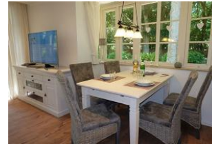
...der Tisch ist schon gedeckt !