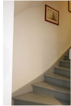
...die Treppe ins Dachgeschoß