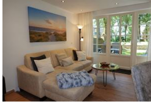
...machen Sie es sich gemütlich!