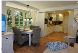
Derr Esstisch, die offene Küche.