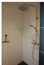
... die offene, bodengleiche Dusche im OG

Entfernungen, zirka: zum Bäcker 80 m, zur Einkaufsmöglichkeit 2,0 km, zum Flugplatz 2,5 km, zum Golfplatz 2,7 km, zum Hafen 3,0 km, zum Meer 50 m, zum ÖPNV 250 m, zum Badestrand 50 m, zum Ortszentrum 2,0 km