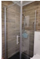
Die bodengleiche Dusche im Erdgeschoß.