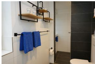
Toilette und Ablagemöglichkeiten...