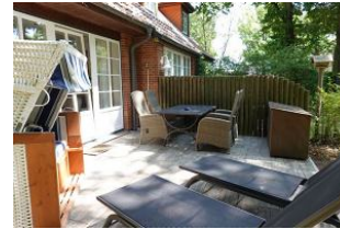
Die Terrasse mit Tisch und gemütlichen Sesseln....