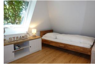
...hier stehen zwei Einzelbetten.