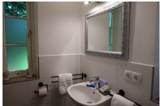
Das Bad im Erdgeschoß, nicht im Bild die Toilette