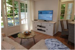
...ein großes TV Gerät für einen tollen Film ....