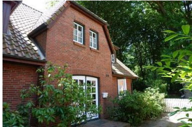
Die Aussenansicht des Hauses Eulenkamp 6c

Die Unterkunft verteilt sich über EG und 1.OG.