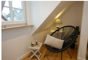
Das Lesezimmer im OG