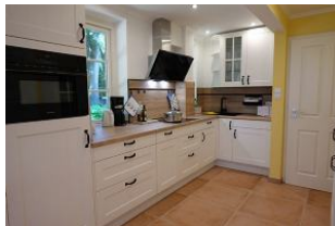
...hier die Küche von der anderen Seite aus gesehen.