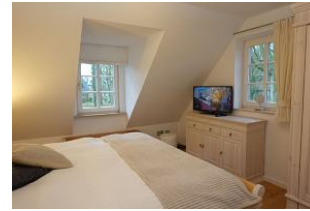
...und ein TV - Gerät