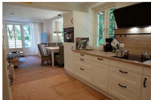
...der Blick in die Küche und zum Essplatz