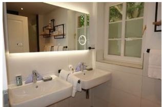
Das Bad im OG mit zwei Waschtischen