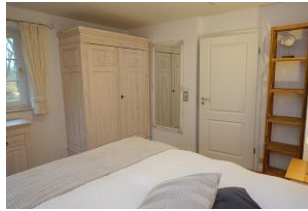
Der große Kleiderschrank für Kofferhalte