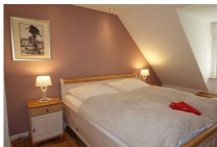
Das Elternbett misst 180x200cm