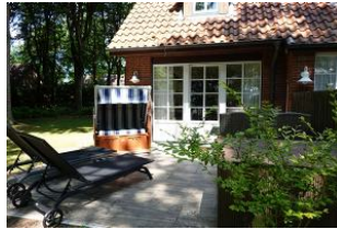
...Strandkorb und zwei Liegen.