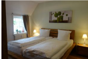
Ein Schlafzimmer mit Doppelbett 180x200 cm Verdunkelungsmöglichkeit.