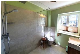
Das großzügige Tageslichtbad mit begehrter Regendusche.