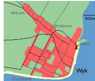
Entfernungen, zirka: zum Bäcker 25 m, zur Einkaufsmöglichkeit 25 m, zum Flugplatz 3,0 km, zum Golfplatz 3,0 km, zum Hafen 50 m, zum Meer 2 m, zum Badestrand 2 m, zum Ortszentrum 0 m