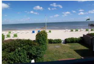
Das Foto zeigt den Blick vom Balkon des Hauses und das lädt zu jeder Jahreszeit ein. Hier können Sie einen Erholungsurlaub der kurzen Wege mit Nordseeluft pur genießen. Man spürt regelrecht die leichte Meeresbrise.....