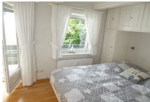
Der Schlafraum mit Doppelbett liegt im 1. OG Richtung Strand und hat ebenfalls einen Balkon mit Meerblick.