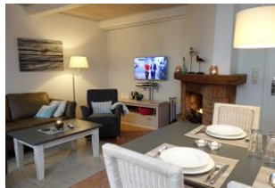
...mit Kamin und TV Gerät