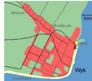
Entfernungen, zirka: zum Bäcker 25 m, zur Einkaufsmöglichkeit 25 m, zum Flugplatz 3,0 km, zum Golfplatz 3,0 km, zum Hafen 50 m, zum Meer 2 m, zum Badstrand 2 m, zum Ortszentrum 0 m