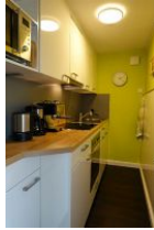
Die Küche mit allem drum und dran.