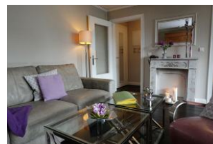
und noch einmal in Nahaufnahme.