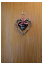
Herzlich Willkommen, treten Sie ein....