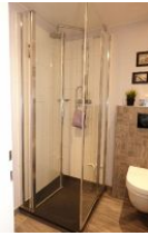
...geräumiger Duschkabine, bodengleich !