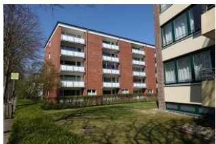
Die Frontansicht des Hauses Gmelinstr. 8 in Wyk

Unsere gemütliche Ferienwohnung dient Ihrer "Auszeit" Klein aber oho kommt sie daher, modern, mit viel Liebe zum Detail eingerichtet. Das große Wohnzimmer mit Essplatz und offener Küche, Zugang auf den Balkon, Schlafzimmer und das Bad mit bodengleicher Dusche lassen keine Wünsche offen. Nur 50m zum Wyker Südstrand, ein kleiner Kaufmannsladen "um die Ecke" Besser gehts nicht, Urlaub von Anfang an.