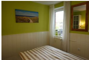
Das Schlafzimmer mit dem Fenster zum Balkon