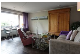
..ein großes, helles Wohnzimmer erwartet Sie..