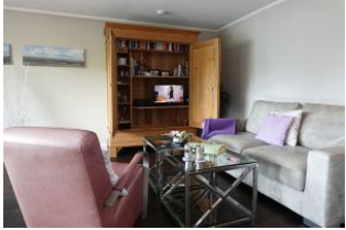
Geschickt versteckt, das TV Gerät im alten Schrank.