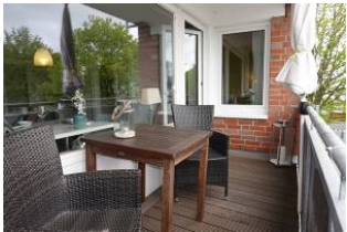
...von der anderen Seite, das Fenster im Hintergrund gehört zum Schlafzimmer.