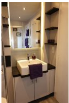
Das Duschbad mit Handwaschbecken,