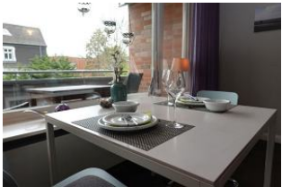
Der Esstisch am Fenster