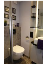
...und die Toilette