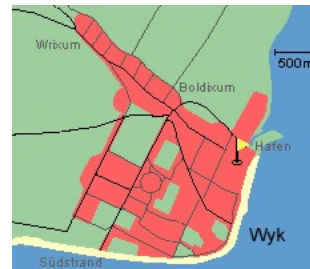
Entfernungen, zirka: zum Bäcker 70 m, zur Einkaufsmöglichkeit 150 m, zum Flugplatz 3,0 km, zum Golfplatz 3,0 km, zum Hafen 300 m, zum Meer 100 m, zum ÖPNV 300 m, zum Badestrand 100 m, zum Ortszentrum 20 m