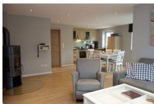
Der gemütliche Sitzbereich mit Blick zum Esstisch und zur Küche. Platz.